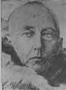
CAPITAN ROALD AMUNDSEN

Durante los días siguientes estudiábamos las condiciones de la deriva y observamos la variación magnética y también la situación meteorológica. Mientras volábamos hacia el Norte habíamos observado una área de unos 30 minutos de latitud norte, sin ninguna indicación de tierra. Considerando la profundidad descubierta por nuestros sondeos